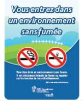
Type 4 (15" x 20")