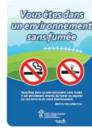
Type 3 (18" x 25")