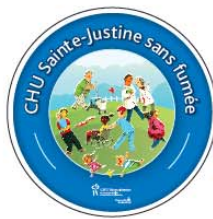
Type 6 (20" x 20")