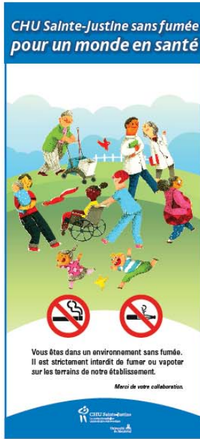
Type 2 (30" x 63")