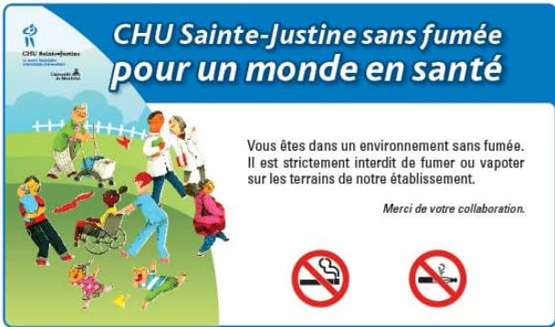
Type 1 (60" x 36")