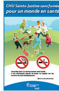
Type 7 (20" x 30")