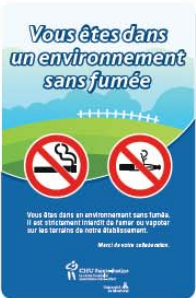
Type 5 (20" x 30")